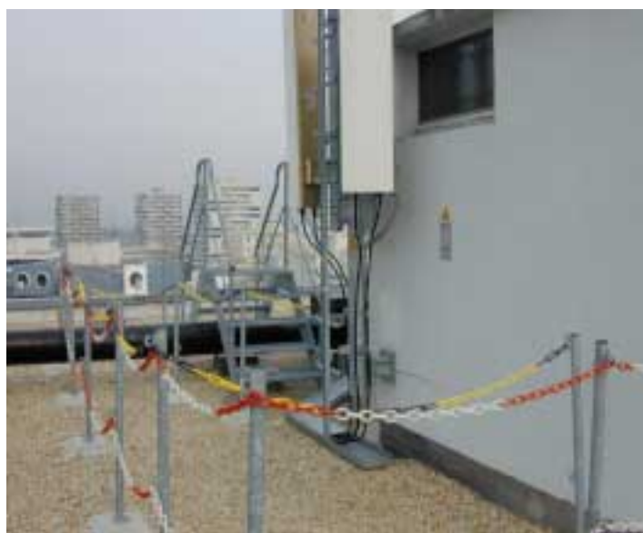
Périmètre de sécurité

mobile lorsque celui-ci se trouve dans une situation de réception médiocre qui le contraint automatiquement à s'adapter en utilisant sa puissance maximale d'émission dans le sens du retour vers la station de base.